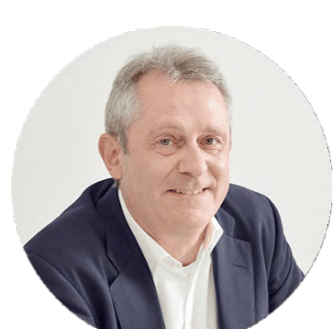
デービッド・ アトキンソン