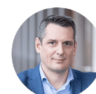
ミハエル・ マーティン

1&1 Mobilfunk GmbH (1&1 Mobilfunk GmbH、 1&1 AGの子会社) CEO