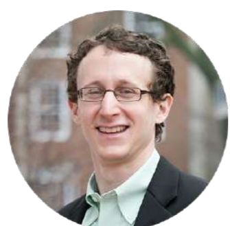
スコット・ コミナース

a16z crypto社 リサーチ パートナー、ハーバード・ ビジネス・スクール 経営 学教授、ハーバード大学 経済学部 付属教職員