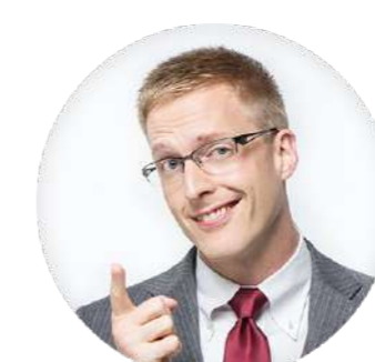
厚切りジェイソン