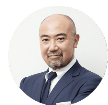
楠木 建 一橋ビジネススクール 教授