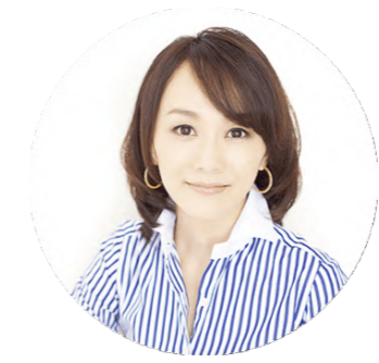
木佐 彩子 「Rakuten Optimism 2022」司会者、 フリーアナウンサー