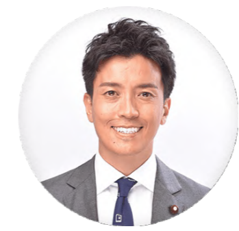
小林 史明 自民党副幹事長 衆議院議員