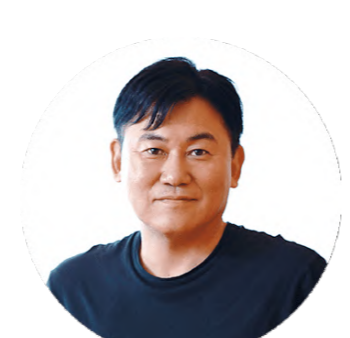
三木谷 浩史 楽天グループ株式会社 代表取締役会長兼社長