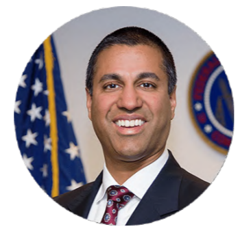
アジット・パイ Searchlight Capital Partners パートナー