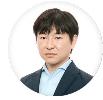
紺野 俊介 楽天グループ株式会社 執行役員 アド&マーケティング カンパニーヴァイスプレジデント 広告事業事業長