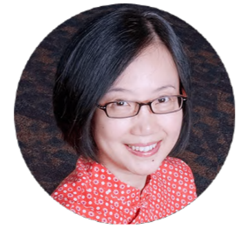
ジ・ファン Divinia社 創業者兼社長