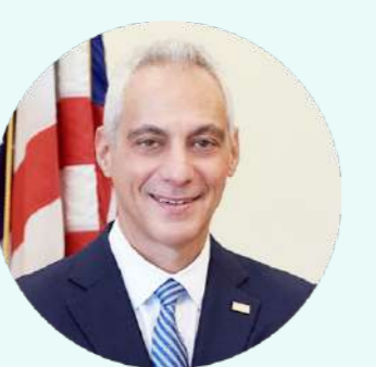
ラーム・エマニュエル 駐日米国大使